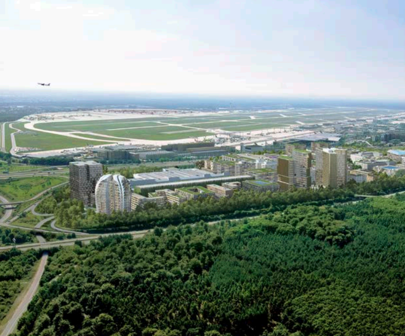
Der Frankfurter Stadtteil Gateway Gardens liegt direkt gegenüber Terminal 2 des Frankfurter Flughafens.